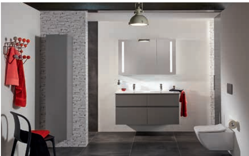
Verity von Meisterbad: geradliniges Design in europäischer Spitzenqualität

Hobbyplaner und Wellnessprofis. 65 der besten Installationsbetriebe Österreichs haben nach einem Weg gesucht, wie sich das Kundenbedürfnis nach Online-Shopping mit den speziellen Erfordernissen der Badezimmgestaltung vereinen lässt, und daraus die Marke Meisterbad entwickelt. Wer www.meisterbad.at öffnet, wird zu allererst einmal von schönen Badfotos inspiriert. Man findet Tipps zu wichtigen Themen wie Renovierung, barrierefreie Gestaltung oder auch zu praktischen Accessoires. Eine intuitiv zu bedienende Planungs-App lädt jeden dazu ein,