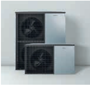
Außeneinheiten im modernen, zeitlosen Design, aus eigener Entwicklung und Herstellung – Made in Germany.

Beruhigt zurücklehnen: Die Wärmepumpenanlage ist per Smartphone steuerbar und auf Wunsch per Internet mit dem Kundendienst verbunden.